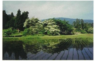
市指定天然記念物 今洞群生地