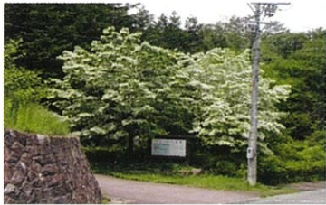
中学校横のひとつばたご公園

蛭川では自生木22本のほか、あちらこちらでヒトツバタゴを見ることができます。ヒトツバタゴは蛭川の人たちにより大切に守られ、毎年白い花を咲かせています。さあ、「ひとつばたごめぐり」に出かけましょう。