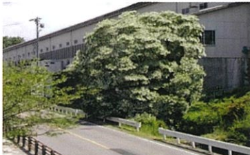
博石館下の自生木