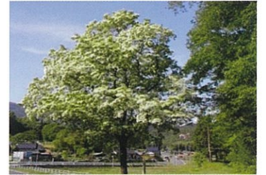
市指定天然記念物 一之瀬のヒトツバタゴ

←国指定天然記念物 長瀬のヒトツバタゴ 大正12年3月7日に国指定の天然記念物となりました。平成6年3月の再調査によると、幹周142cm、樹高14mでした。