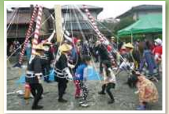
▲石場搗き餅ふるまい